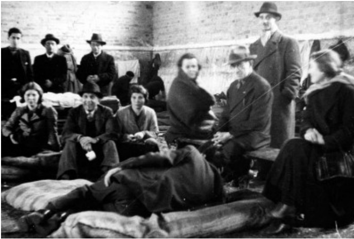
Abb.: Deutsche Juden in Bentschen (Zbąszyń), November 1938

1940, ich denke, es war im Januar, begannen die Deutschen damit, das erste Ghetto aufzubauen. Das war in Łódź. In dieser Zeit änderte sich der Name von Łódź in Litzmannstadt. Ich schaffte es, aus dem Ghetto herauszukommen, genau in der Woche, als sie das Ghetto endgültig absperren. Meine Tante und ihr Mann nahmen mich auf.