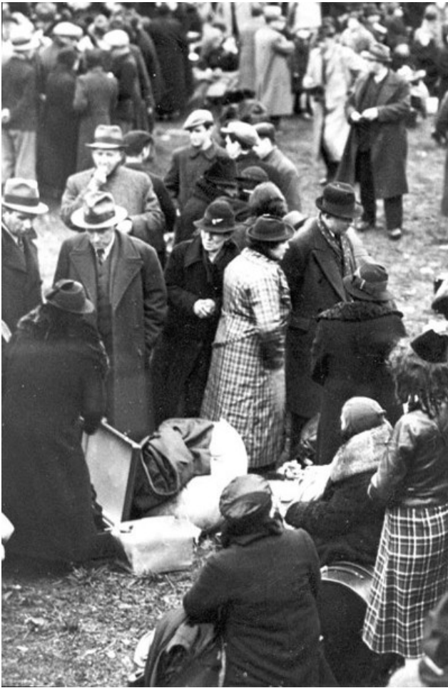
Abb.: Ausgewiesene deutsche Juden in Bentschen (Zbaszyna)

Im Rahmen der so genannten "Polenaktion" am 28. und 29. Oktober 1938 wurden etwa 18.000 Juden polnischer Staatsangehörigkeit (so genannte "Ostjuden") über Nacht aus dem "Dritten Reich" ausgewiesen. Diese Diskriminierungsmaßnahme des NS-Regimes gegenüber den Juden stellte einen ersten Höhepunkt der Verfolgung dar und war der eigentliche Auftakt zur Vernichtung der europäischen Juden. Ein Großteil der Deportierten sammelte sich in dem damaligen Grenzort Bentschen (Zbaszyna).